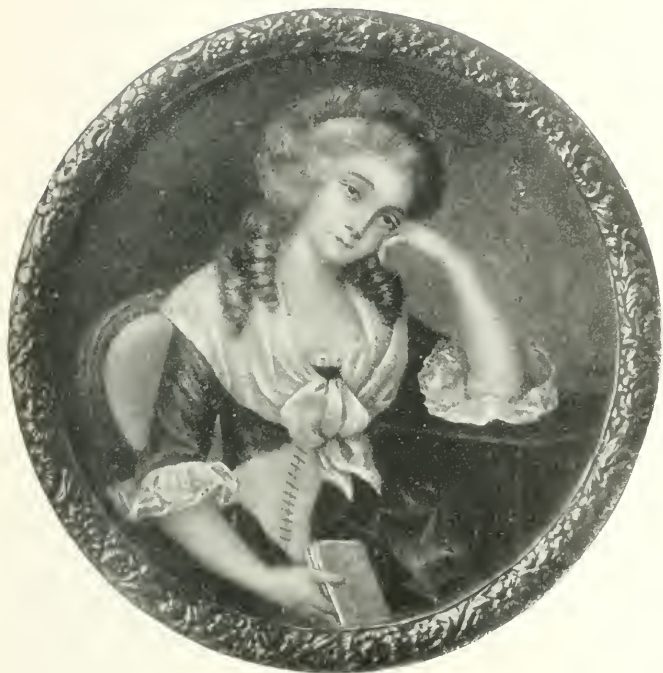
LA PRINCESSE CHARLOTTE DE ROHAN, MARIÉE AU DUC D'ENGHIEN